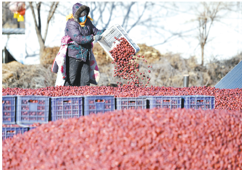
河北行唐:大枣分拣销售忙