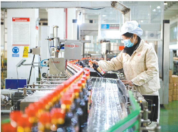
湖南宁乡:食品企业加工忙

12月13日,在加加食品集团股份有限公司酱油生产车间,工作人员在检查酱油品质。近日,湖南宁乡经济技术开发区内的多个食品加工企业开足马力忙生产,保障市场供应。