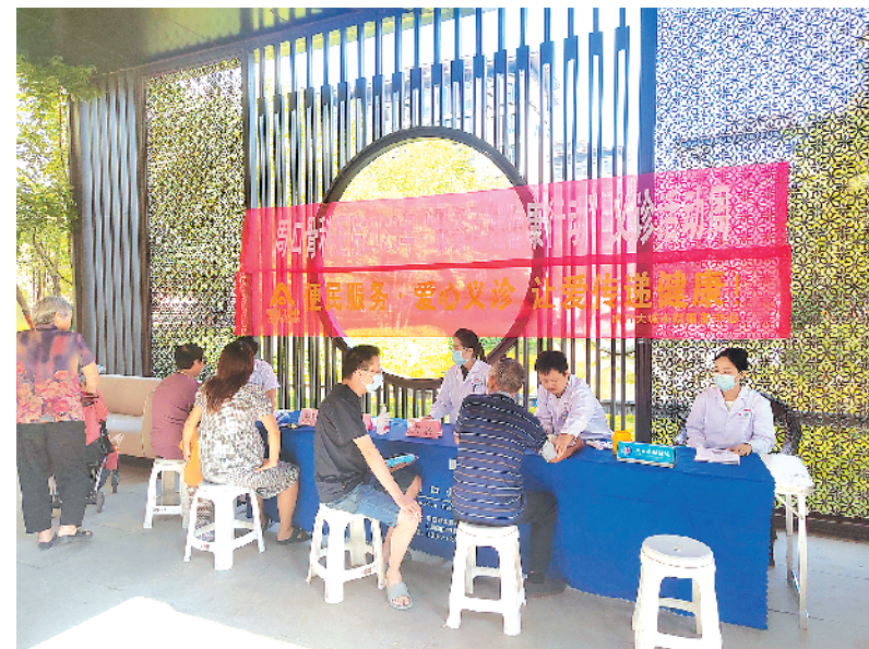
图为义诊活动现场。