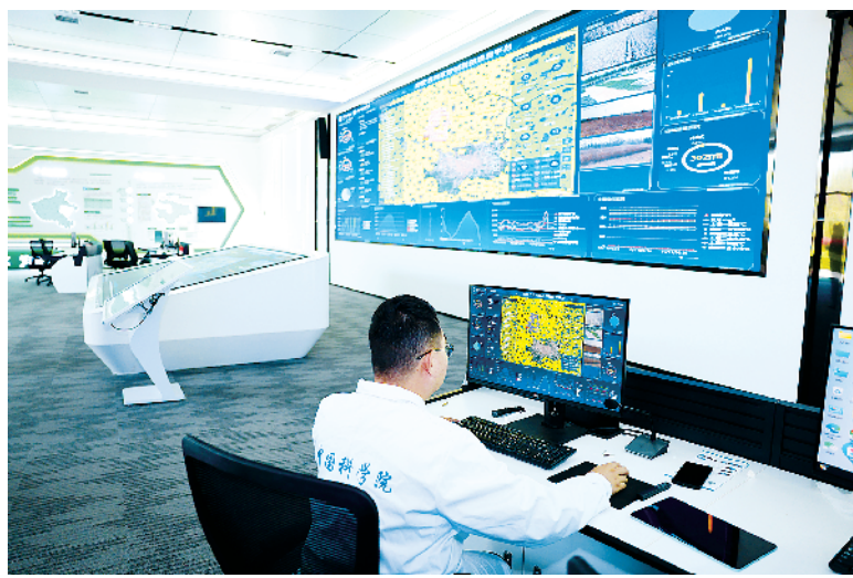
中国科学院技术人员操作智慧农业信息中心平台。

心建设,与周口师范学院共建河南周口国家农高区现代农业产业研究院。坚持错位发展的原则,拟与中原农谷签订长期战略合作协议,与河南农业大学合作建设国家小麦技术创新中心分中心、小麦玉米作物学国家重点实验室,与中国农科院、省农科院、河南农大等10余个种子研发团队合作,坚定不移把农高区打造为黄淮海地区良种繁育基地,实现豫麦、郑麦、周麦全覆盖。