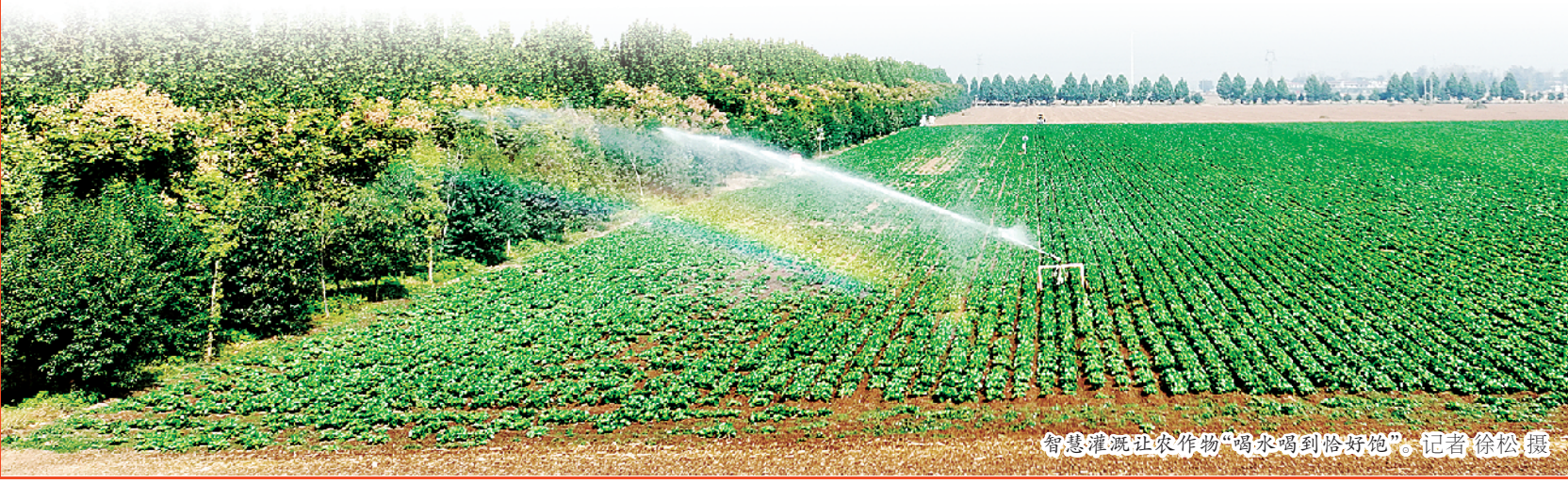
智慧灌溉让农作物“喝水喝到恰好饱”。

该县加快推进城乡教育体系建设,建设县职业中专新校区,新建、改扩建中小学幼儿园20个,义务教育阶段学生实现“零辍学”。依托紧密型县域医共体建设,持续推动优质资源下沉。19个乡镇卫生院实现胸痛单元和急救点建设全覆盖,15个乡镇中医师获省级示范中医师资格。加快推进乡村农医农技服务体系。由8名首席专家、106名科技骨干组成基层农技推广服务队,实现农技推广服务全覆盖。加快推进乡村商贸服务体系建设。县城建成4300平方米的数字化仓储中心。19个乡镇建设200家“供销便利店”,实现“一个平台、一网通用、一体融合、一店多能”。打造县级综合商贸中心(增强型)2个,升级改造乡镇商贸中心19个。投资1.7亿元建设农村“四好”公路和通村人组道路240公里。建成3个县级物流园区、18个乡镇物流快速配送中心,完成村级便利店数字化改造,实现物流配送服务全覆盖。 为加快推进城乡人居环境建设,该县探索“户分类、村收集、乡转运、县处理”垃圾处理模式。整治残垣断壁、废弃宅基地、空心院3476处,整理清退土地3521.6亩。 县长董鸿表示,郸城县将认真贯彻落实市委、市政府的决策部署,持续保持“人一之、我十之”的竞进状态和“一天当作两天用”的姿态,弘扬实的作风、提升干的能力,奋力完成各项目标任务,为率先建成农业强市贡献郸城力量。