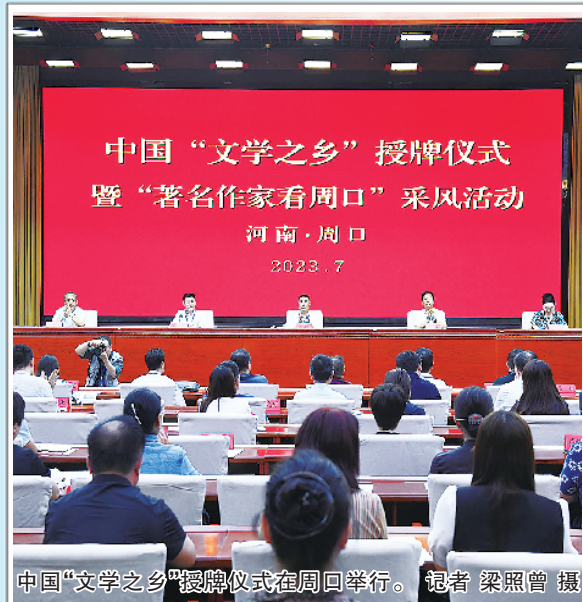
中国“文学之乡”授牌仪式暨“著名作家看周口”采风活动在周口举行。