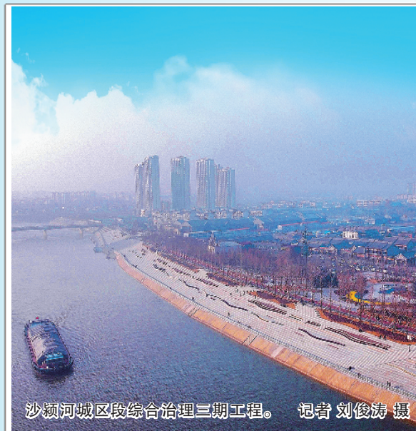
沙颍河城区段综合治理三期工程。