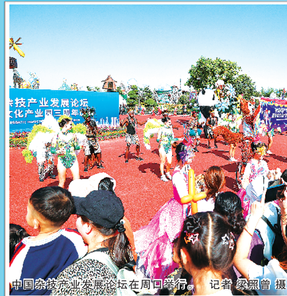
中国杂技产业发展论坛在周口举行。

岁序常易,华章日新。从2023年到2024年,时间再次刻印下前行的坐标。一年来,周口经济运行态势呈现新气象,创新驱动发展见到新成效,产业体系构建取得新突破,农业强市建设迈出新步伐,现代物流体系彰显新优势,城乡融合发展焕发新活力,群众幸福指数得到新提升,社会治理实现新加强,交出了开局之年“奋勇争先、更加出彩”的优异答卷。奋进的姿态、创新的魄力、改革的决心、开放的气度……2023,值得被记录。过去的一年,周口都有哪些大事发生?又怎样影响着周口儿女的生活?本报为你一一梳理。