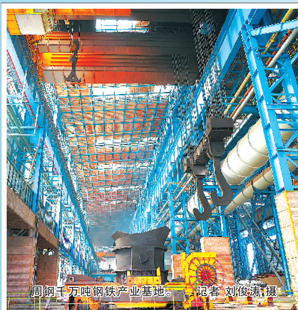
周口千万吨钢铁产业基地。