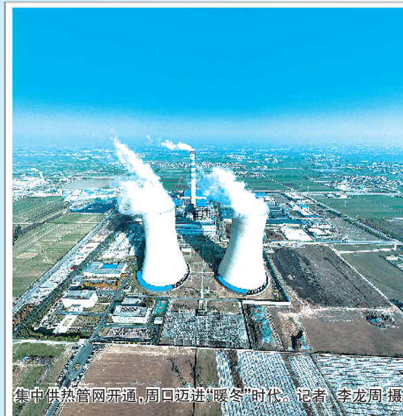
集中供热管网开通,周口四县“暖冬”时代。