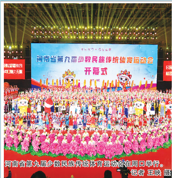
河南省第九届少数民族传统体育运动会开幕式在周口举行。