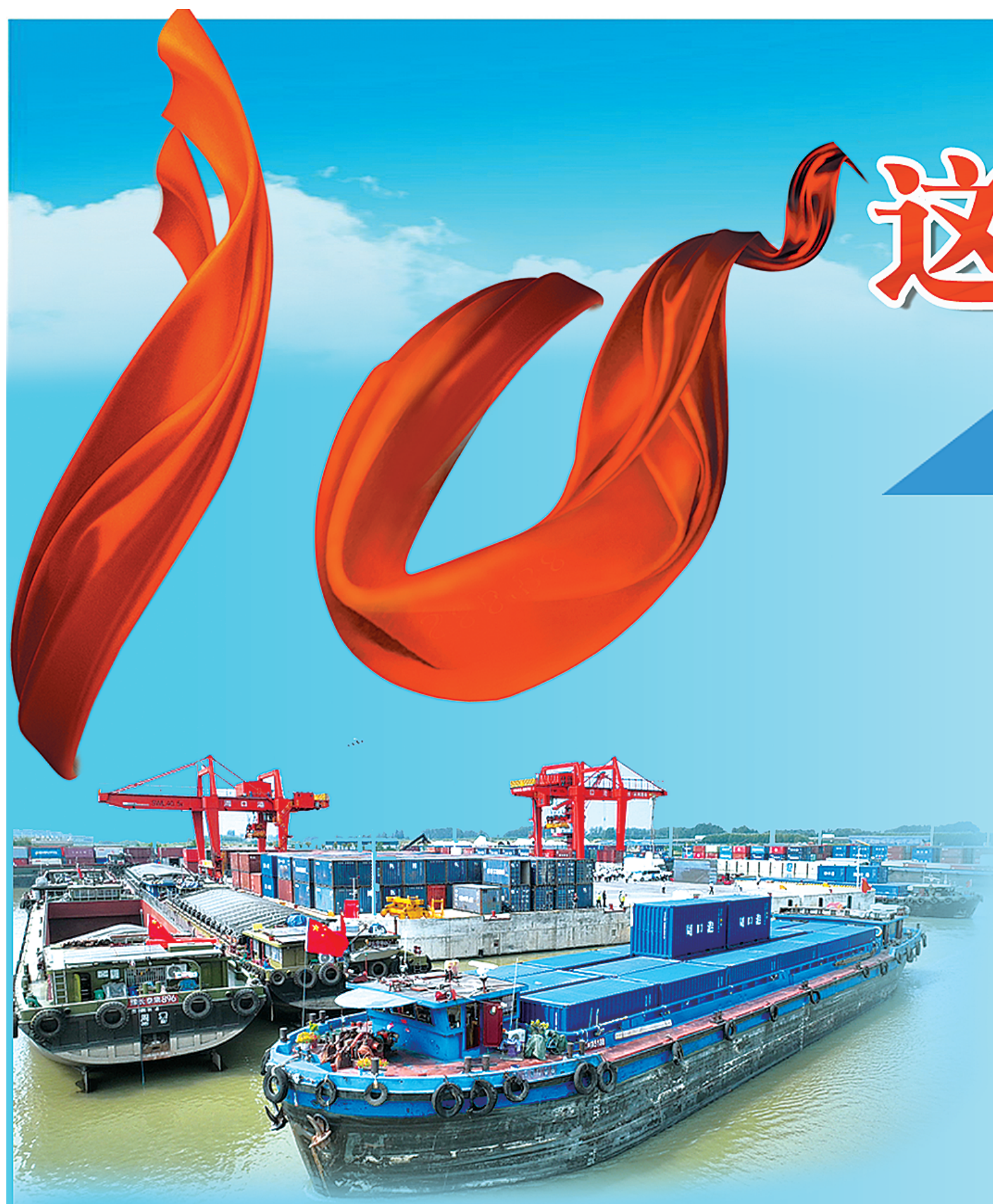
周口中心港开通至合肥港、芜湖港新航线。