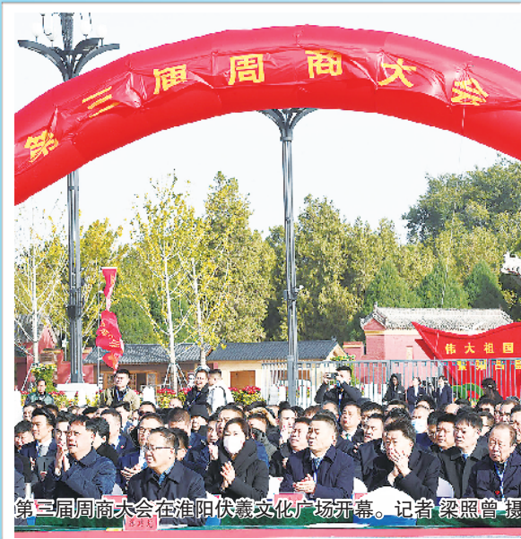
第三届周商大会在淮阳区伏魔文化广场开幕。