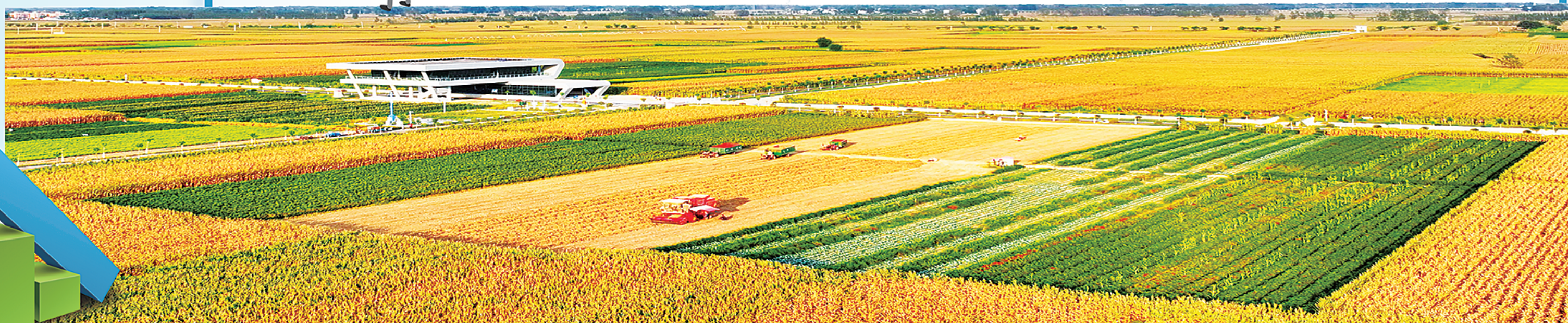
河南周口国家农高区郸城县30万亩高标准农田示范区。