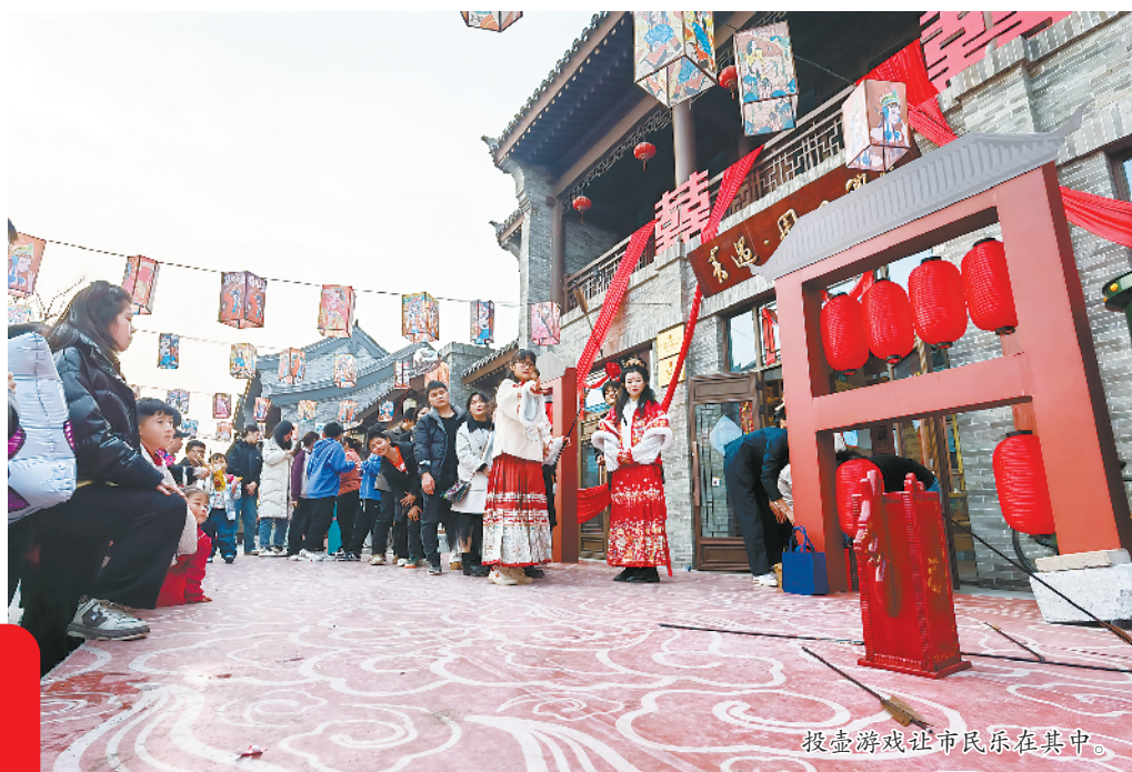
投壶游戏让市民乐在其中。