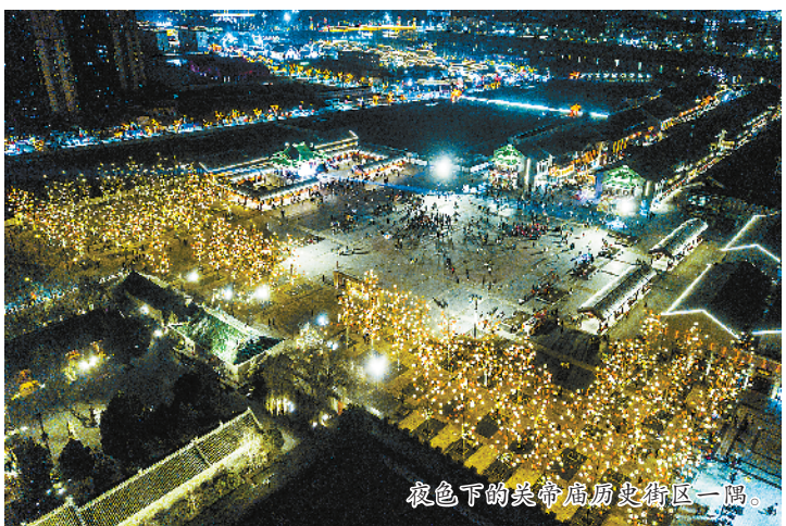
夜色下的关帝庙历史街区一隅。

作为“春满中原·老家河南”活动的主会场之一,周口在关帝庙历史街区举办的首届“三川十馆·春会”内容丰富、形式多样,吸引了众多市民前来逛古街、赶大集、赏民俗、看表演、听戏曲、观花灯、品美食……欢欢喜喜过大年。