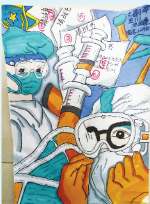
小记者：沈目瞳 证号：222910 周口市文昌小学五（1）班