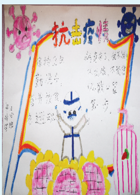
小记者：祁梓淇 证号：220758 周口闫庄小学三（8）班 (辅导老师：王亚杰)