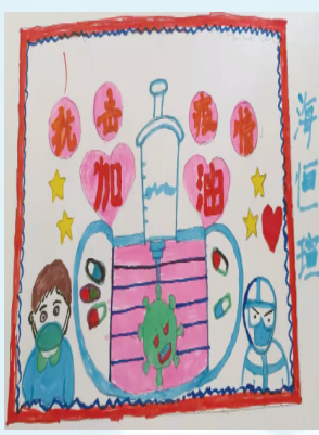
小记者：海恒瑄 证号：220685 周口闫庄小学一（8）班 (辅导老师：马娜娜)