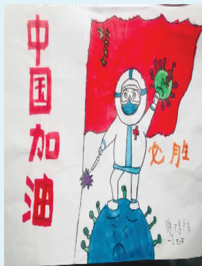
小记者：党洛祎 证号：221031 周口六一路小学一（2）班