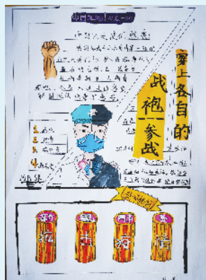
小记者：孙一铭 证号：222899 周口市文昌市小学五（1）班