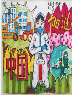
小记者：冯子曦 证号：222911 周口市文昌小学五（1）班