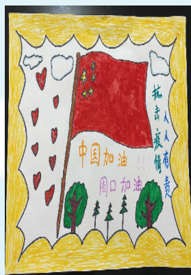
小记者：胡航宇 证号：220680 周口闫庄小学一（8）班