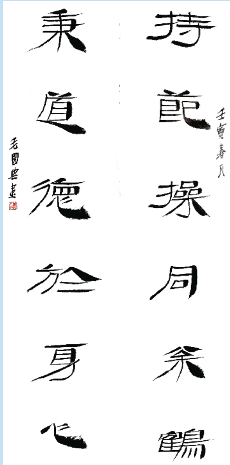
毛国典 中国书法家协会副主席、江西省书法家协会主席

编者按:墨香浸润沙颍河畔,笔力雄健魅力三川。为大力弘扬和培育社会主义核心价值观,传承周口地域文化特质和精神标识,日前,周口市文明办、周口市文学艺术界联合会、周口市书法家协会通过周口报业传媒集团发出“作品征集令”,拟举办社会主义核心价值观暨“道德名城”名家书法作品展。作品征集启事发出后,周口籍书法名家及广大书法爱好者纷纷投来精彩纷呈的书法作品,体现对社会主义核心价值观的深刻理解,展示“道德名城、魅力周口”建设成果。今天起,本报陆续刊发优秀书法作品,敬请关注。③2