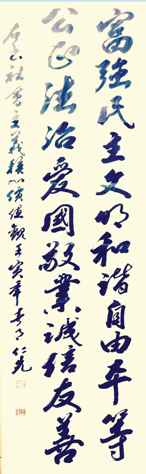
穆仁先 中国书法家协会会员、原周口市政协主席