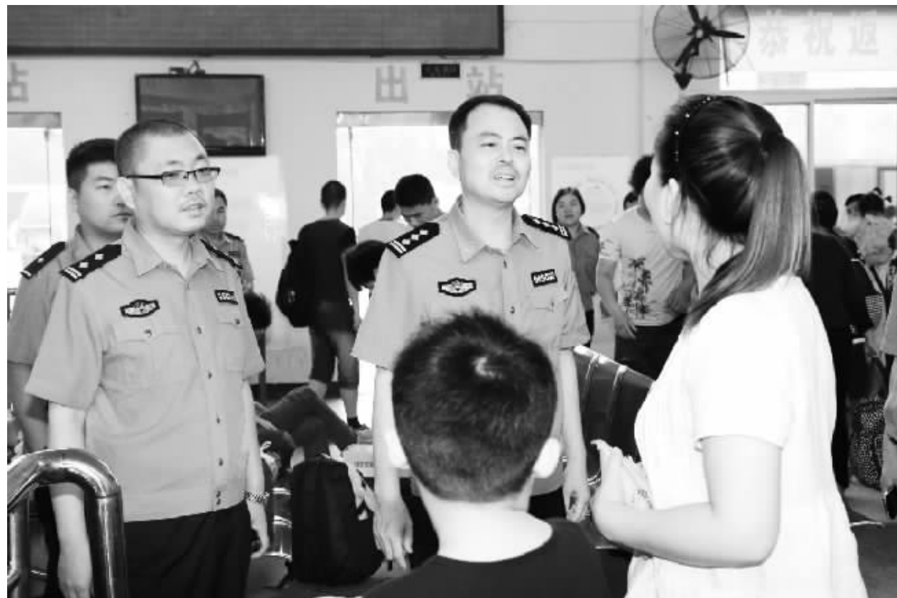
连日来,扶沟县公安局明确任务,落实责任,按照“屯警街面、动中备勤、武装巡逻”的要求,进一步加大巡逻防控力度。图为民警在汽车客运站防控排查。