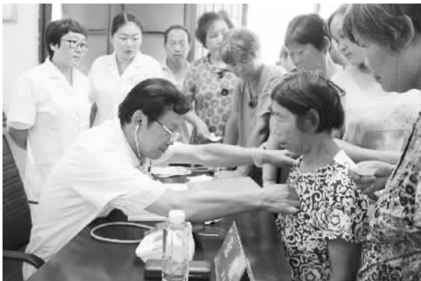
昨日,省中医药研究院附属医院专家们在川汇区中医院举行大型义诊咨询活动。图为义诊活动现场。

度,凡是签订过拆迁协议的要及时拆掉,确保按计划完成任务。东新区、开发区要积极配合施工单位,对已经补偿过的要抓紧清表,为施工单位顺利进场提供施工作业面。施工单位要加快速度,在有作业面区域进行施工,大干快上,拉开场面,迅速掀起建设施工高潮。